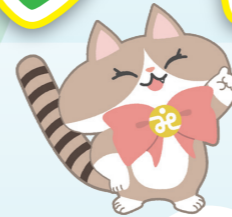
川崎市社協キャラクター「ななふく」